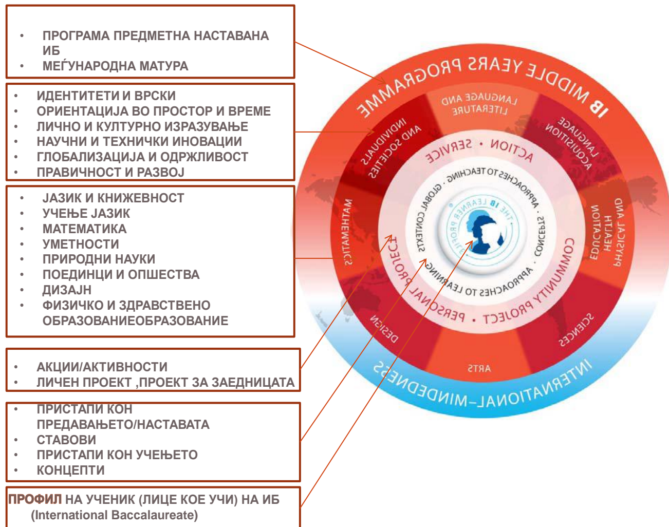
МУР Преглед на реализирани наставни содржини по ИБ програмата за учебната 2014 -2015 год